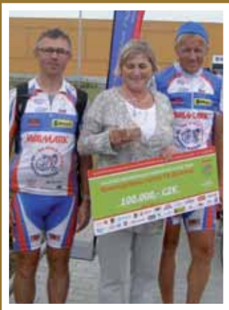
Šance má další peníze, takže děti mohou spokojeně vyjet...